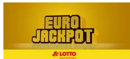
Anzeige: EUROJACKPOT. Lotto Baden-Württemberg