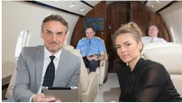
Anzeige: Mehr Zeit. Mehr Geld. Mehr Leben.

Hausmeister lassen besondere Umsicht walten